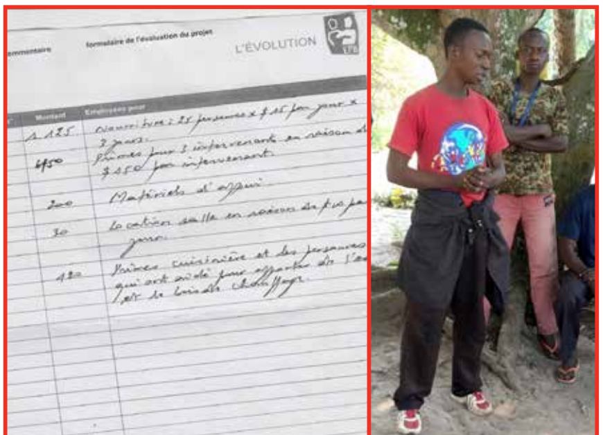
Project 1838: verslaglegging (l), jongeren in gesprek met elkaar (r)