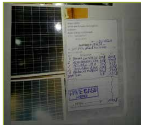
Project EPB 1711 | 2 Zonnepanelen + accu's met rekening van aanschaf aug. 2017

Ieder jaar sturen de gesteunde projecten hun rapportage. Helaas is hebben in 2017 niet alle projecten hun rapportages kunnen sturen maar... gelukkig ontvingen we een aantal foto's van deze projecten. De energie en kracht komt daar uit naar voren. Ze hebben de energie om door te gaan. Vaak is dat door de rol van de paters, zusters en andere leken in onze projecten. Zij zijn de sociale werkers die direct contact hebben met de jongens, meisjes, vrouwen en dorpelingen. Zij motiveren ze om de handen uit de mouwen te steken. Wij voorzien hen ten dele met