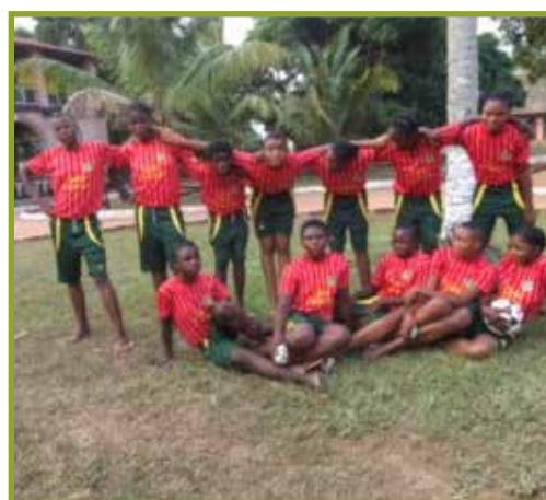
Voetbal verbindt jongeren, en stimuleert samenwerking voor in de toekomst

In december en januari hebben we weer vele aanvragen gehad voor projecten in de dorpen en wijken in onze provincies Kasayi. Het is gewoon triest om te lezen in wat voor situaties ze verkeerd hebben in 2017. Sommige projecten van 2017 hebben ze niet uit kunnen voeren. Toch hebben ze de energie om weer op te krabbelen. De overlevingsdrang is gelukkig hoog ondanks alle politieke onlusten in het land. Met de verhalen van die ellende vallen we u niet lastig. Kennis maken met hun nieuwe aanvragen is interessanter. Wij willen de mensen ter plaatse toch blijven steunen in hun behoeften en wensen.