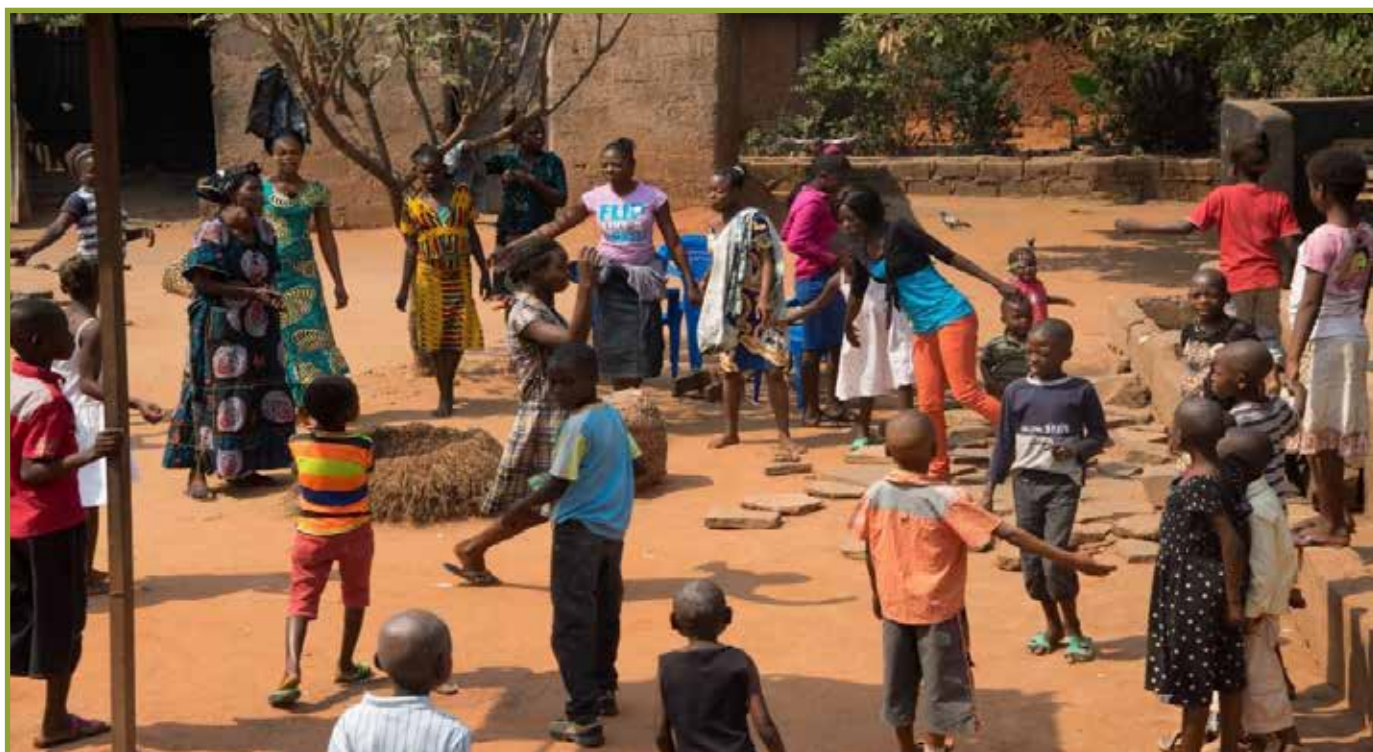
Overlevingsdrang in een weeshuis, samen dansen maakt plezier ondanks alles

de financiële middelen om dat te doen. Wij, en hopelijk ook u, zijn blij met de beelden die ze toesturen. Met korte lijstjes weten we welke goede doelen we steunen in de Congo provincies Kasayi. U blijft toch ook aan onze mensen geven!