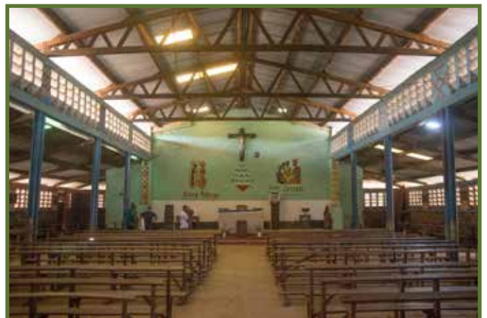
Kerk in Bilomba