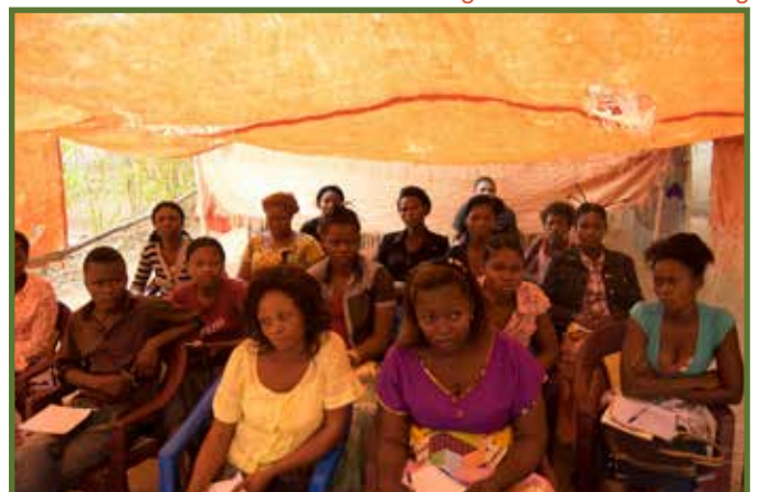
Leerlingen luisteren aandachtig